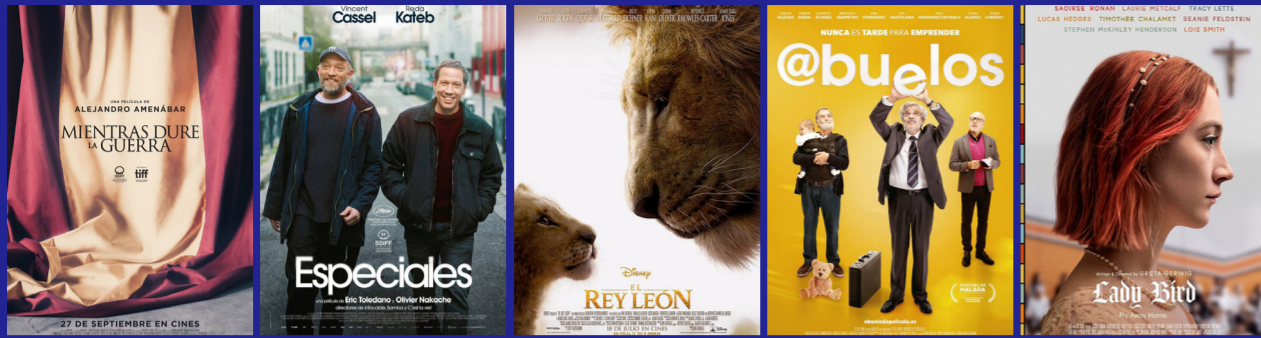
Mientras dure la guerra